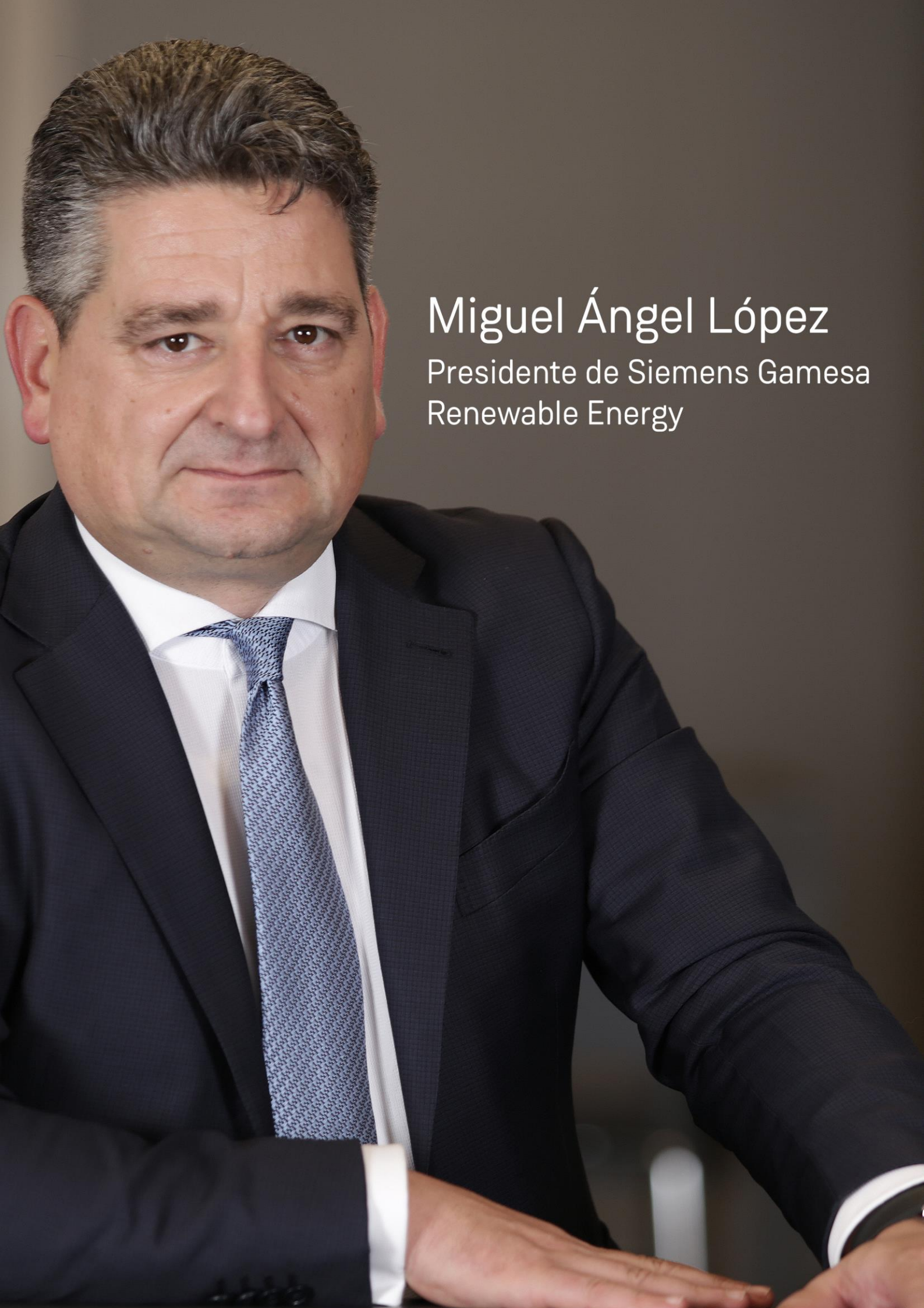
Miguel Ángel López Presidente de Siemens Gamesa Renewable Energy